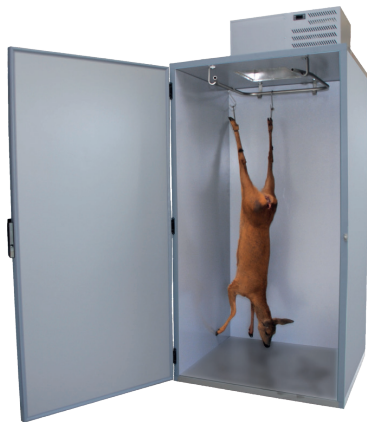
Abb. WKS 1100

Für eine optimale Nutzung des Innenraums ist eine umlaufende Rohrbahn eingebaut mit Vorsteckrohr, um schweres Wild vor dem Schrank einzuhängen.